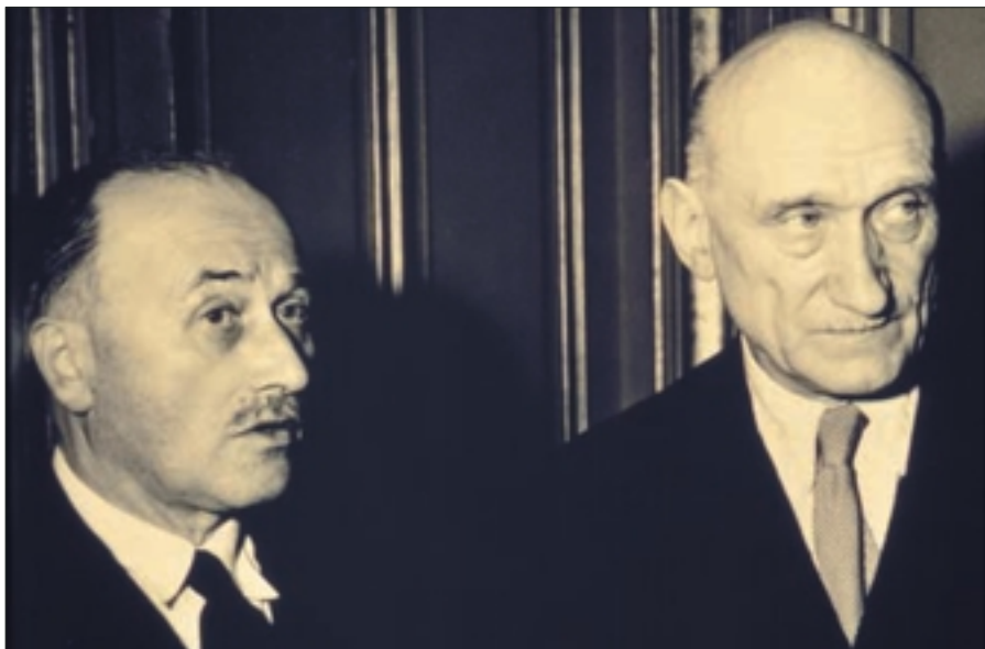
Jean Monnet a Robert Schuman