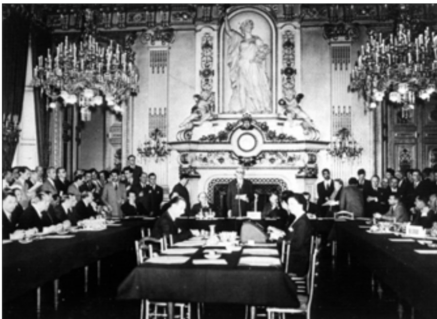
Představení Schumanova plánu 9. května 1950 v Salon de l'Horloge v Quai d'Orsay. U mikrofonu francouzský ministr zahraničí Robert Schuman; po jeho pravici Jean Monnet.

Pro dosažení úspěchu bylo třeba ohraničit cíle na vymezené, psychologicky důležité oblasti a zavést společný rozhodovací mechanismus, na nějž by mohly být krok za krokem přenášeny další a další pravomoci.