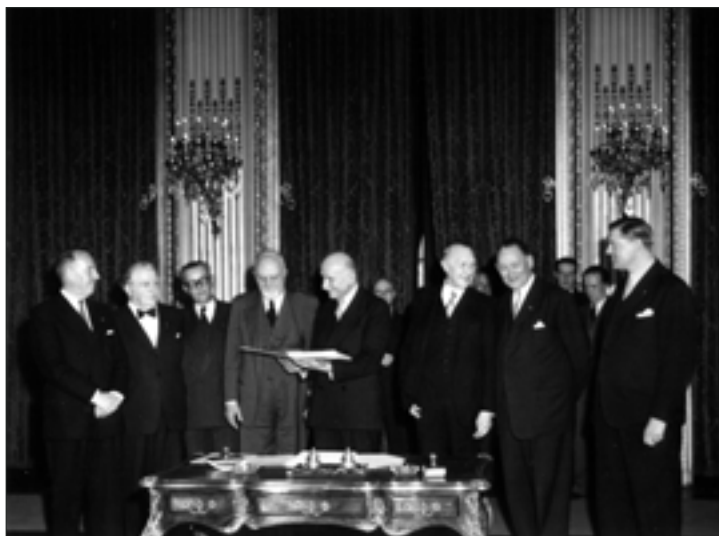
Po Schumanově deklarovaci z 9. května 1950 následuje 18. dubna 1951 podpis Pařížské smlouvy, první zakládací smlouvy Evropského společenství.

18. dubna 1951 byla na období 50 let podepsána Smlouva o založení Evropského společenství uhlí a oceli. Byla ratifikována šesti státy, které podepsaly Smlouvu, a 10. srpna 1952 mohl v Lucemburku začít pod vedením Jeana Monneta pracovat Vysoký úřad.